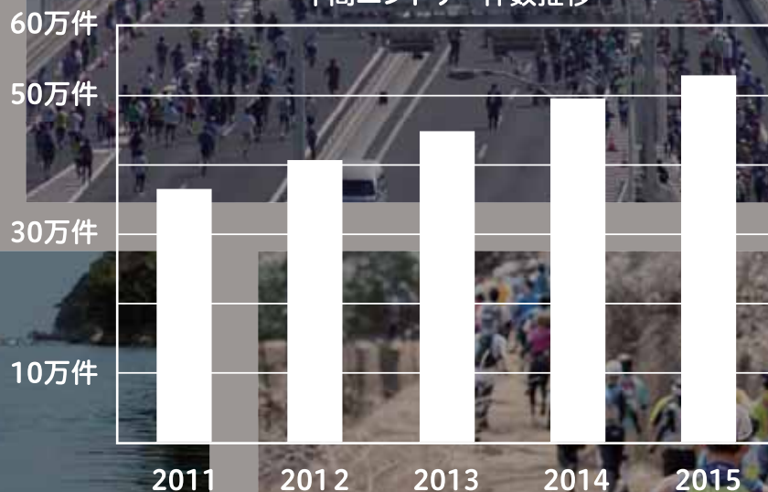
年間エントリー件数推移

消費市場で存在感を高めるサイクルイベントでは取り扱い数、利用者数ともに国内No.1サイトです。